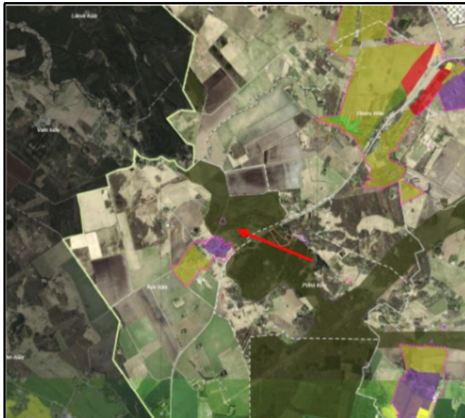
Joonis 5. Väljavõtte ulukiuuringust. Saue valla üldplaneeringus kavandatud rohekoridor ja eelistatud rajatise asukoht

Perspektiivselt on kinnistu lähipiirkonda kavandatud suurulukiläbipääs, mille toimivust on vajalik üldplaneeringukohase ehitustegevuse suunamisega ennetavalt tagada. Kuna nii läbipääsurajatis kui soovitava elukondliku hoone asukoht paiknevad rohevõrgustikus, siis peab hoone planeerimine tagama rohevõrgustiku toimivuse.