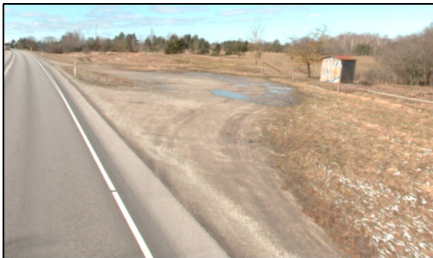
Joonis 3. Väljavõtte teevideost (aprill 2024)

Kõnealune ristumiskoht on ajalooliselt teenindanud põllu- ja metsamajandamise maad ning selle ümberkujundamine elukondliku hoone juurdepääsu kavandamiseks ei ole sobilik. Olemasolev lai killustikuala ei ole mõeldud püsivaks igapäevaseks (elukondliku hoone) kasutuseks (vt joonis 3 ).